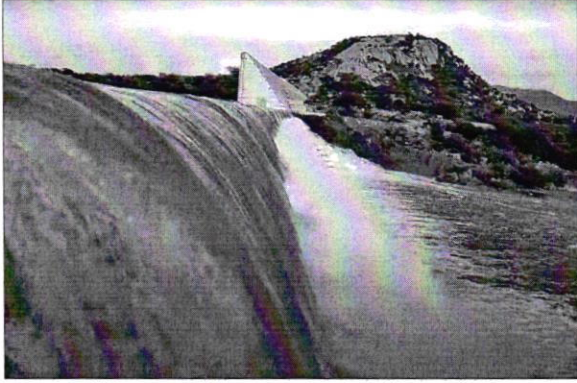
Barragem de Oiticica sangrou na última terça. Estado recebeu média de 135 milímetros

As chuvas registradas nos primeiros 60 dias do ano têm gerado boas expectativas para o povo potiguar, com alguns reservatórios já passando pela "sangria" no começo do ano. A quadra chuvosa, iniciada em meados de fevereiro e que deve seguir até maio, ainda não tem previsões definidas em virtude da presença do fenômeno El Niño no Oceano Pacífico, segundo avaliações da Empresa de Pesquisa Agropecuária do RN (Emparn). A Barragem de Oiticica, em Jucurutu, que ainda está em construção, registrou sangria nesta terça-feira (05).